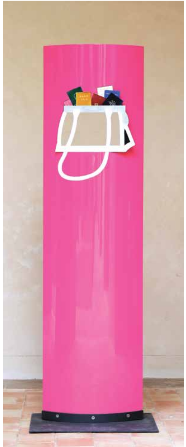
ID 2014 Varnish on Aluminium 210 x 60 x 30cm