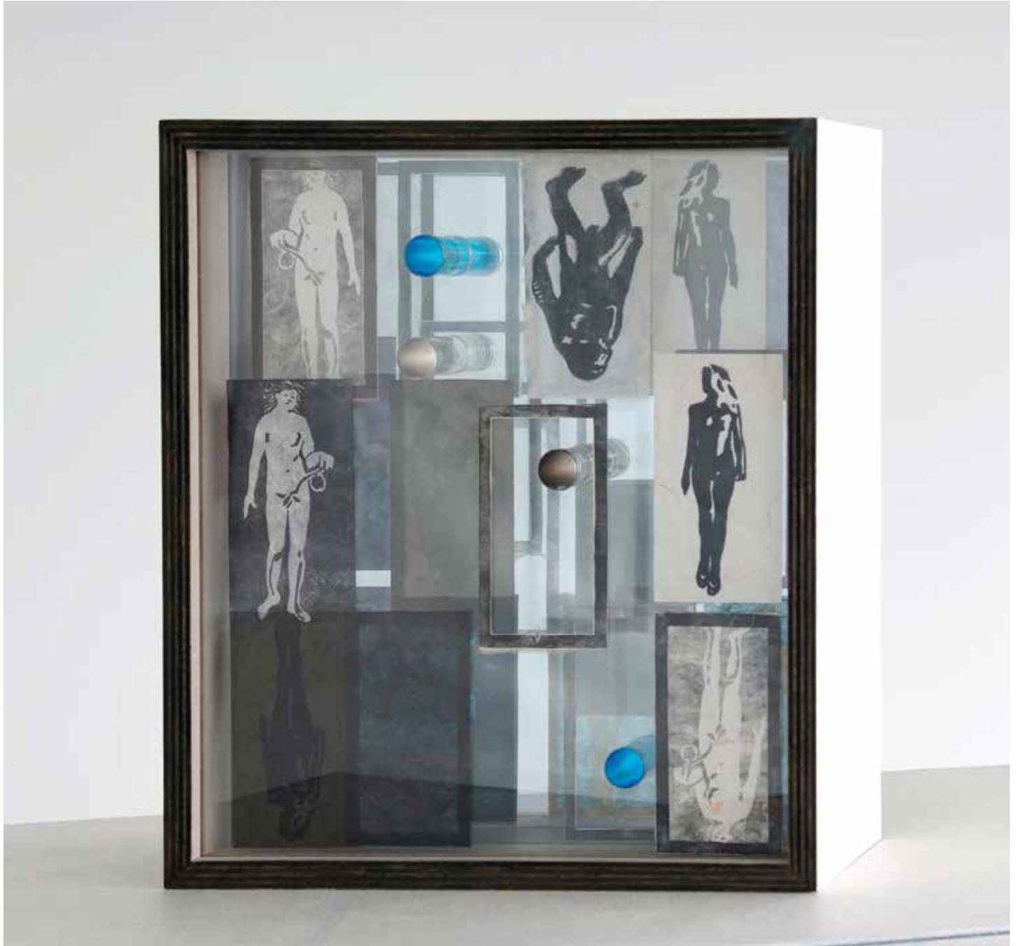
A&E, Framed 2008-2015 Paper Between Plastic Layers, Wooden Frame 48 x 42 x 12cm