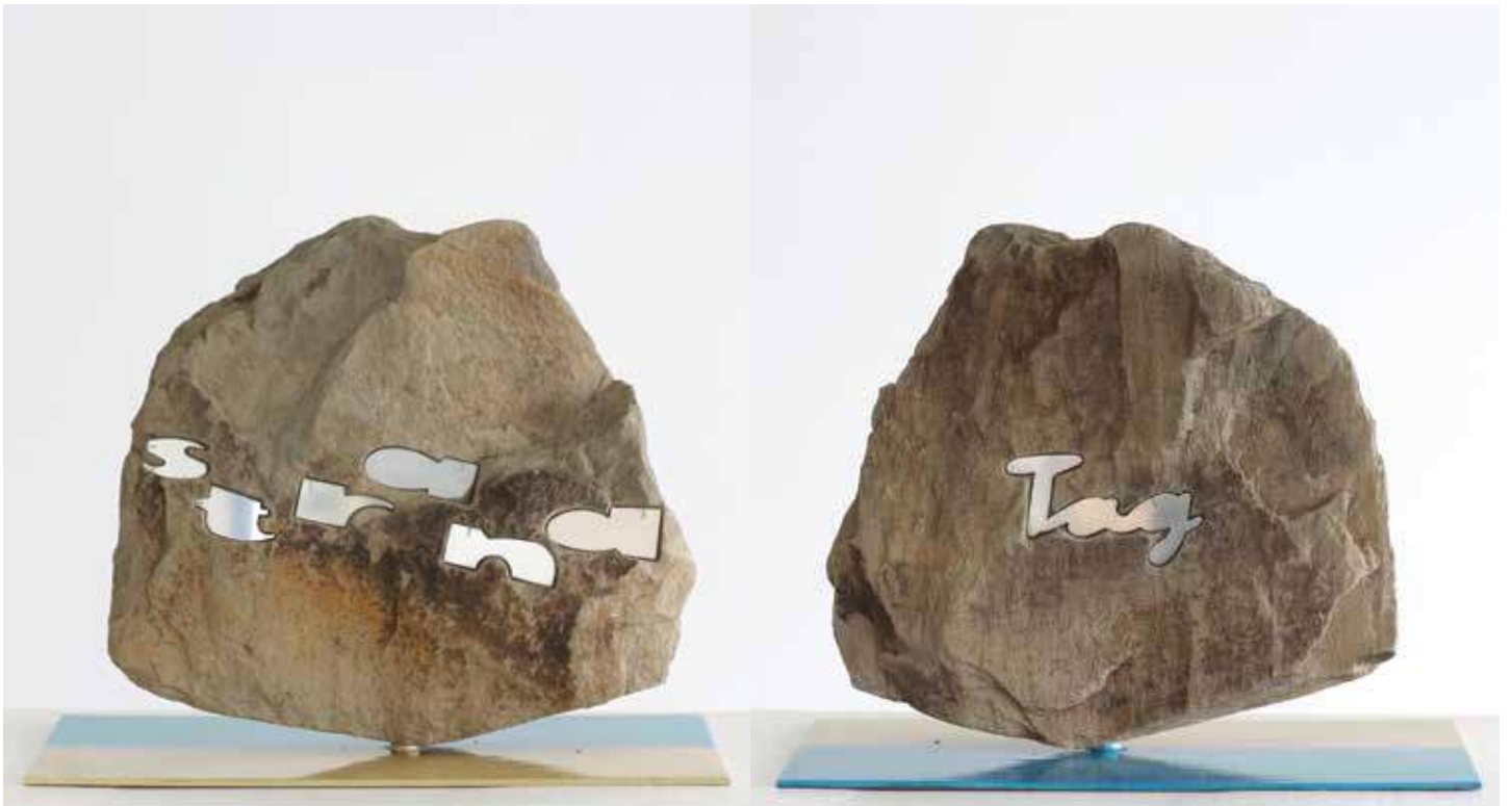
Strand TAG 2011 Shale, Stainless Steel 35 x 35cm