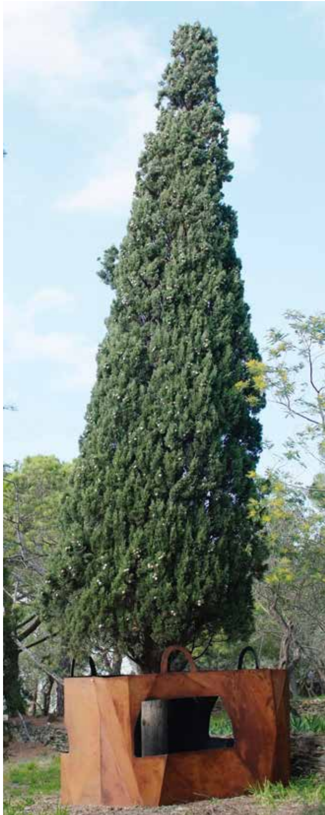
Big Bag 2014 Steel 125 x 150 x 140cm