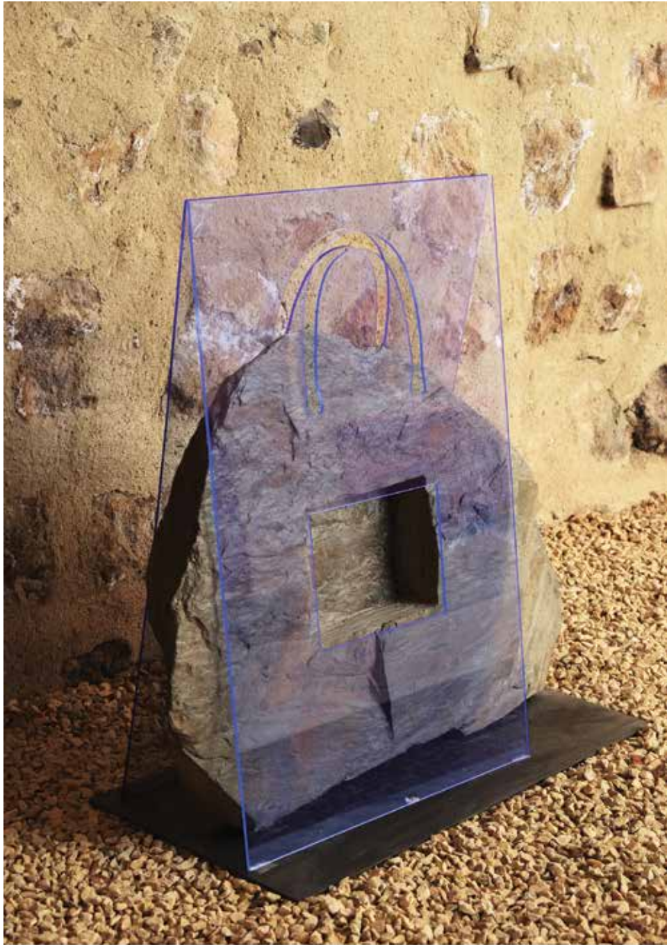
Handle With Care 2014 Shale, Methacrylate 75 x 80cm