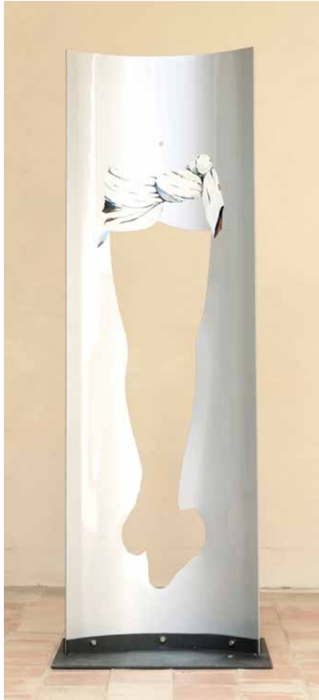
HE Is Not There 2014 Varnish on Aluminium 200 x 63 x 30cm