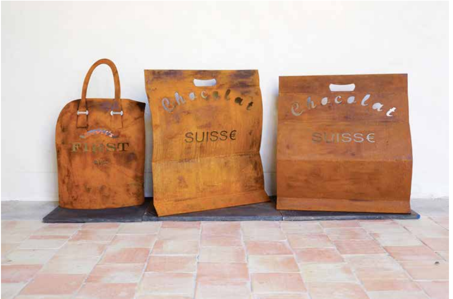
Devil's First Aid, Chocolate Suisse 2014