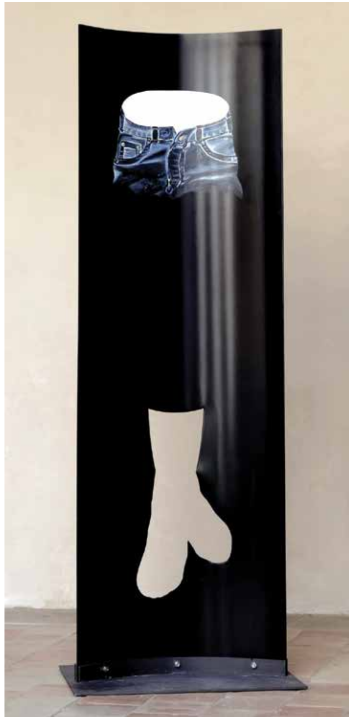
Walking And Falling 2014 Varnish on Aluminium 200 x 63 x 30cm