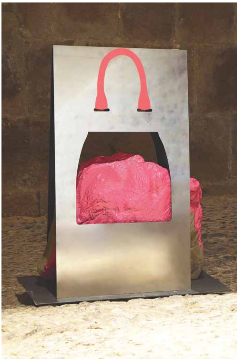
You Cannot Take It With You 2014