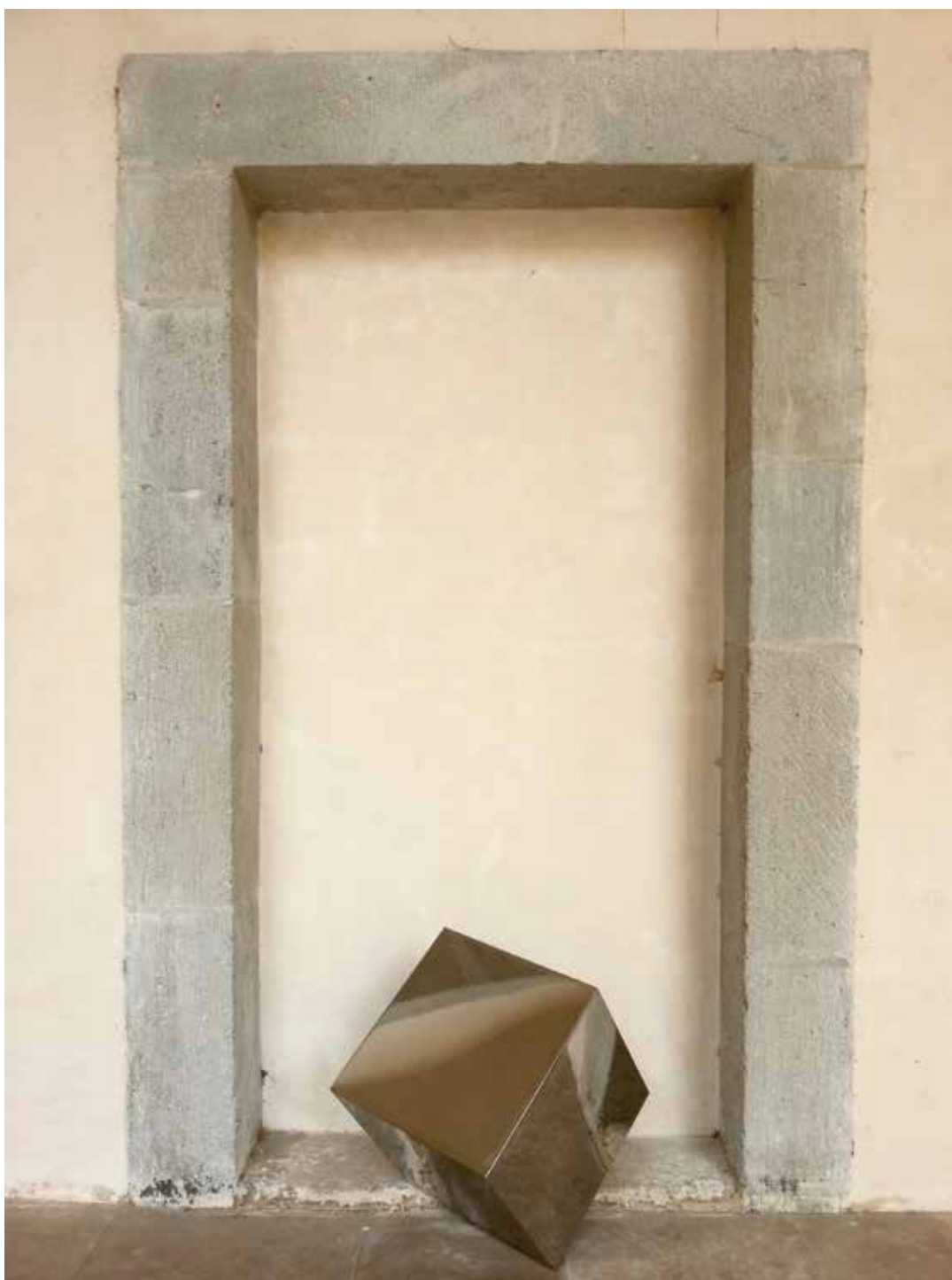
Dice 2010 Stainless Steel 36 x 36 x 36cm