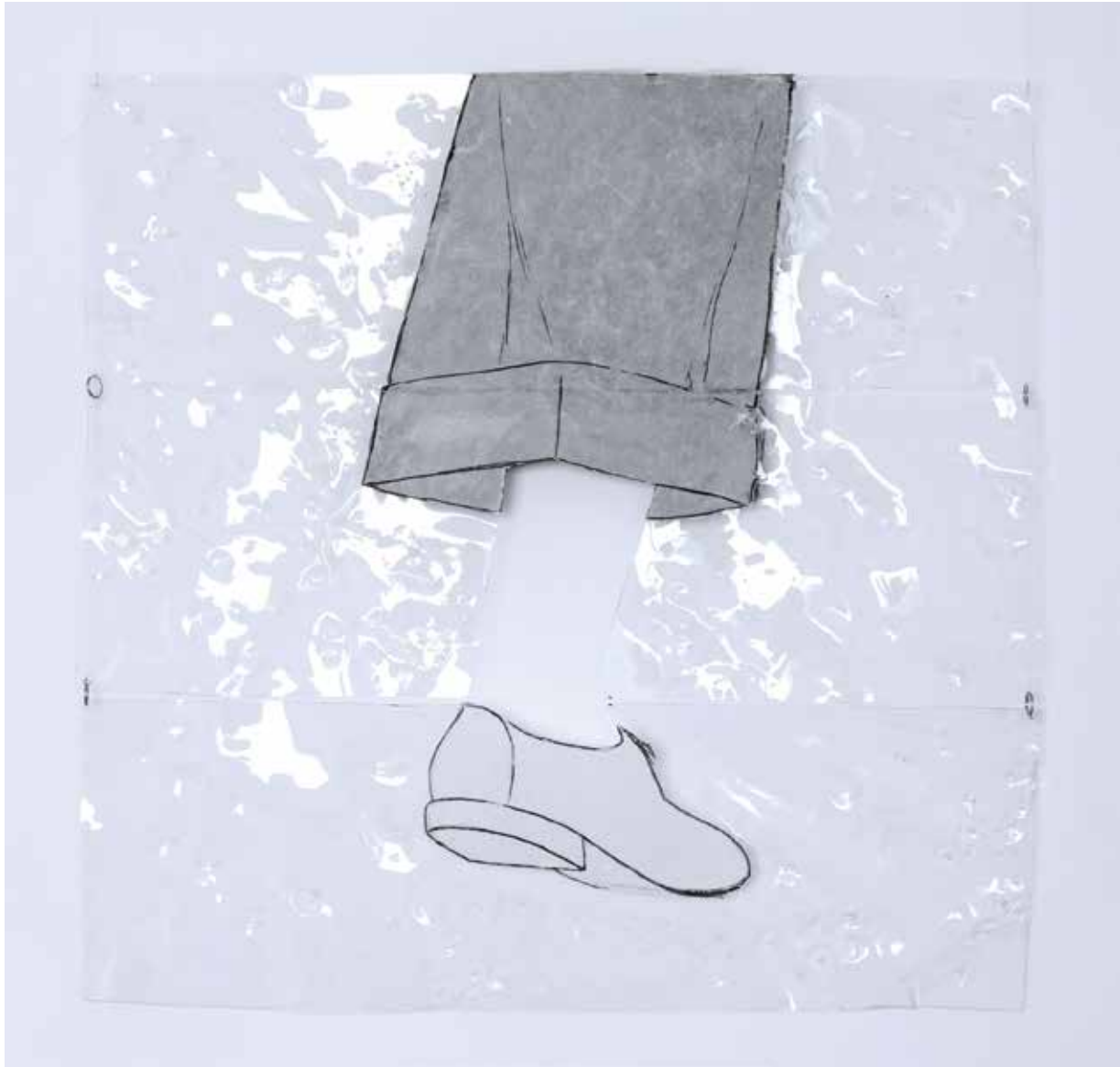
One Step at a Time 2015