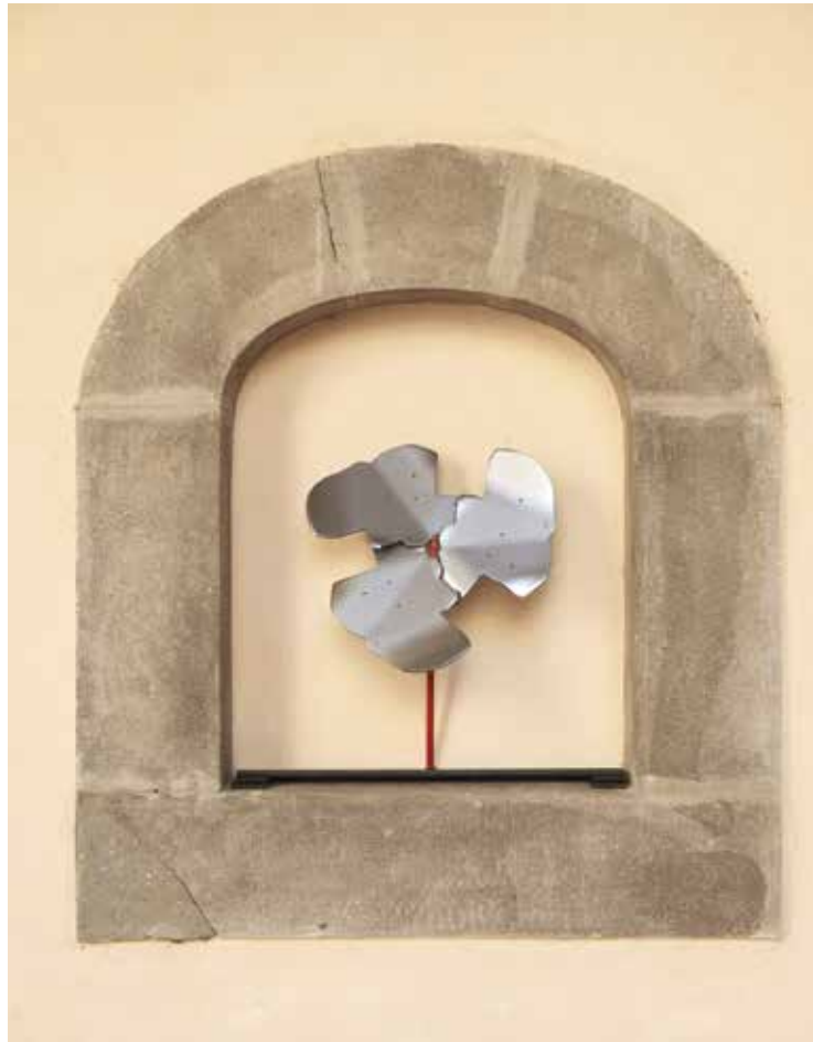
Helix, Small 2014 Varnish on Aluminum 56 x 36cm