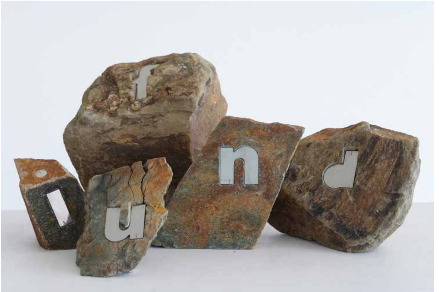
FUN, FOUND 2011 Shale, Stainless Steel h: 10-27cm