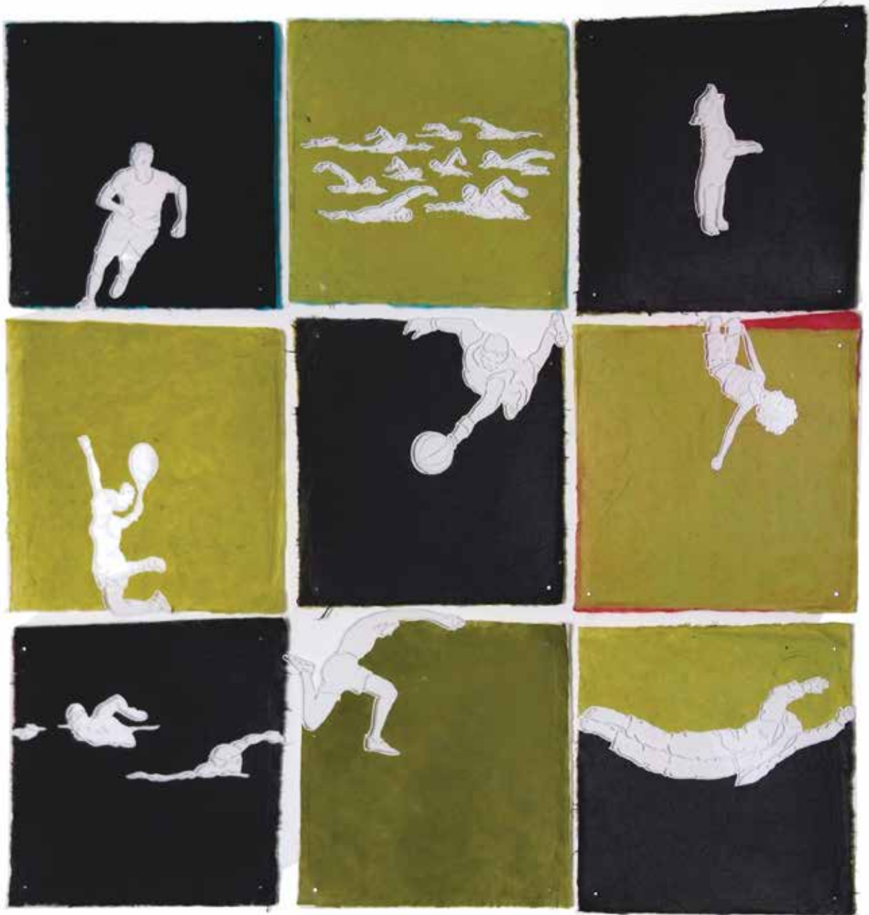
Cut Outs 2015 Paper, Transparent Film 115 x 115cm