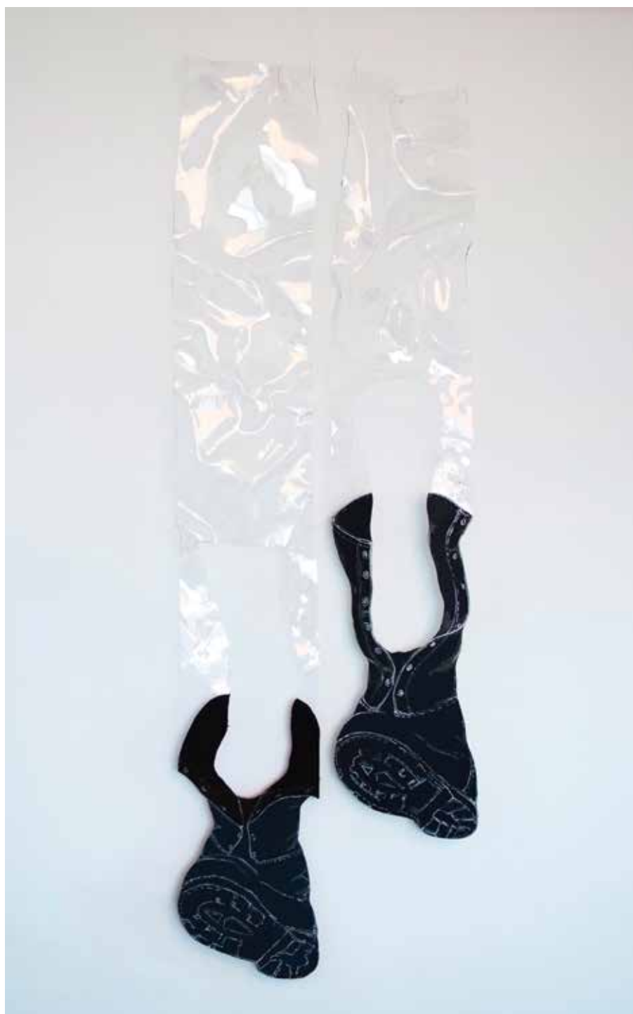
Footloose 2016 Polycarbonate, Leather 140 x 45cm